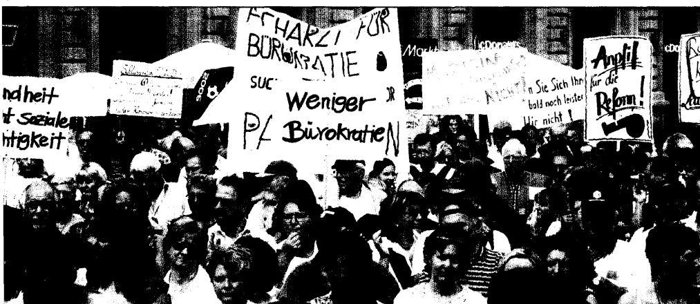
10 Teilnehmer haben gestern für eine bessere Versorgung demonstriert.