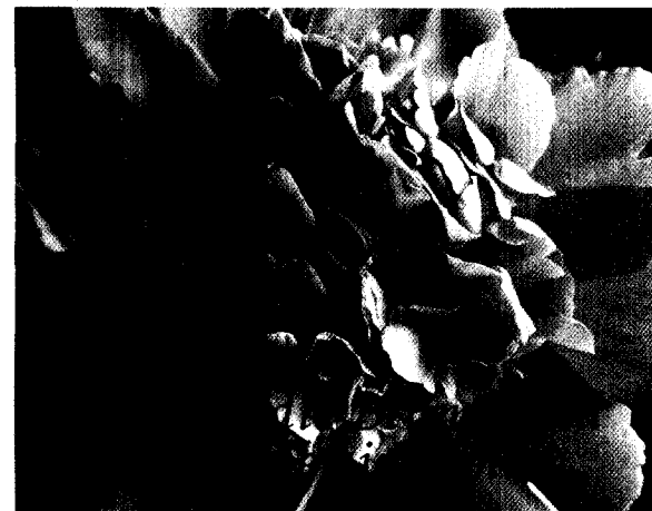
Zen-Bewusstsein bei der Lehre der Palpation ... Für den Autor gleichen die Herausforderungen, die bei den schwierigsten Aspekten der manuellen Therapie auftreten, jenen des Zen-Buddhismus bei der Lehre hin zur Erleuchtung. Aber diese Jahrhunderte alten Traditionen bieten auch Lösungsansätze, die wir übernehmen könnten, um den ... Herausforderungen gerecht zu werden.