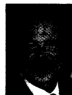
Prof. Dr. Norbert Walter

Die Ärzte werden in den nächsten 10 Jahren von der alternden Gesellschaft profitieren, prognostiziert Prof. Dr. Norbert Walter von der Deutschen Bank.