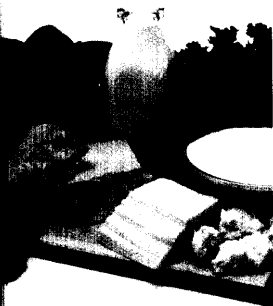
Lebensmittel, die Folsäure enthalten.