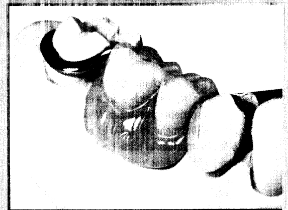
Zahnfarbene Kunststoffe für „unsichtbare“ Klammern