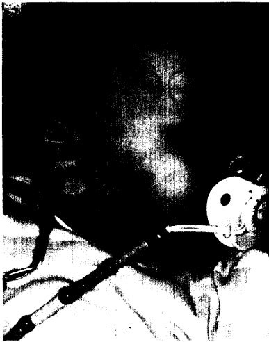
Mit einem konsequenten Hörscreening bei Neugeborenen können vorhandene Hörprobleme früher erkannt und behandelt werden. Seite 6.