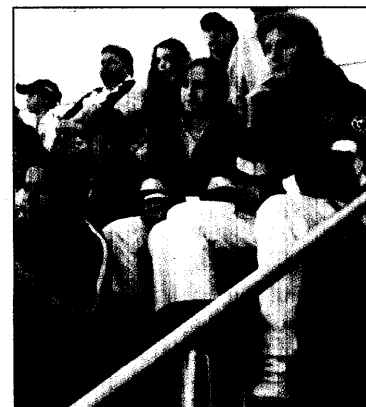
Rot-Kreuz-Mitarbeiter sitzen im Stadion, um im Notfall eingreifen

DT. ZENTRALBIBLIOTHEK TEAM 5.1/25 GEVELER STR. 60 50931 KOELN