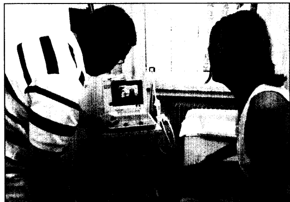
Ein Allgemeinmediziner erklärt seiner Patientin die Bilder der Schilddrüsensono.

Die Patienten teilen dem, zu verbessern. US- in das - und n, die onen.