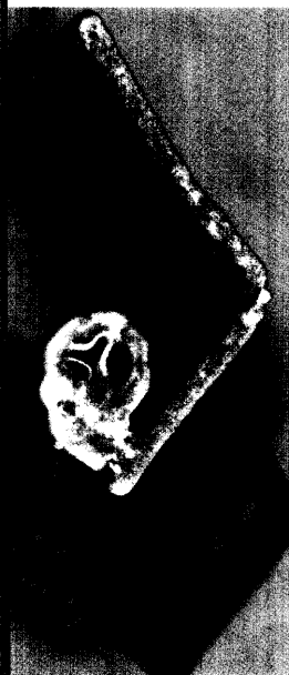
Titelbildvorlage: Aviäres Influenza-Virus vom Typ H5N1 (s. dieses Heft S. 1201).