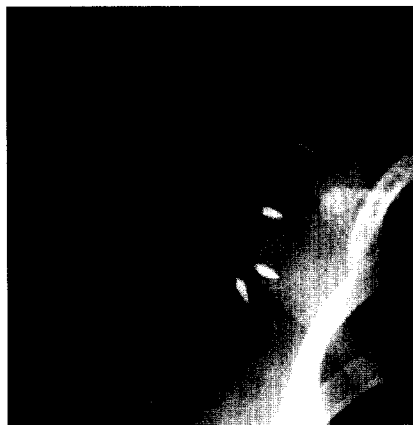
Komplikation bei rekonstruktiver arthroskopischer Schulteroperation: Fehllage eines Titanfadenankers ► Seite 160