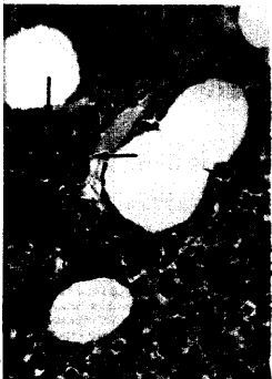
Plasmazellrasen beim Multiplen Myelom.