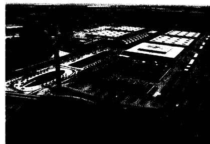
Zur Orthopädie + Reha-Technik im Mai in Leipzig haben sich 10 Prozent mehr Aussteller als im Jahr 2004 angemeldet.