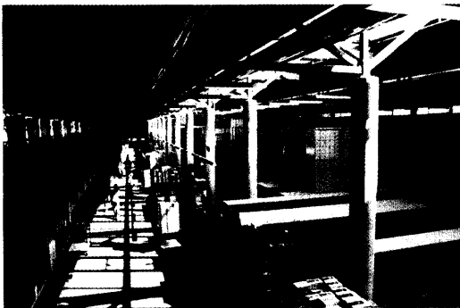
Entwicklung und Produktion von Silikon-Brustprothesen werden vom Amoena-Stammsitz in Raubling aus gesteuert.