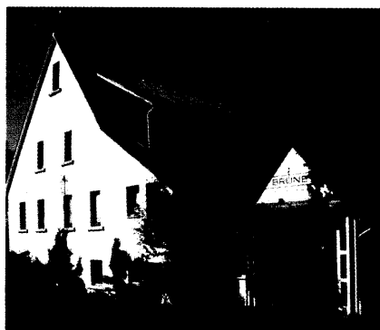
Die Firma Brune Medizintechnik in Aalen ist als Fachhändler bei Ärzten auch mit Blutdruck-Messgeräten erfolgreich.

Sani-Special: Blutdruck-Messgeräte 28–41