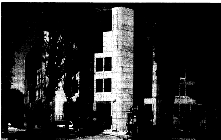
Hollister-Zentrale in Unterföhring bei München.