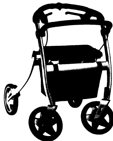
In Deutschland entwickelt und produziert: der Rollator Khargo. Seine intelligenten Funktionen brachten ihm eine Goldmedaille ein.