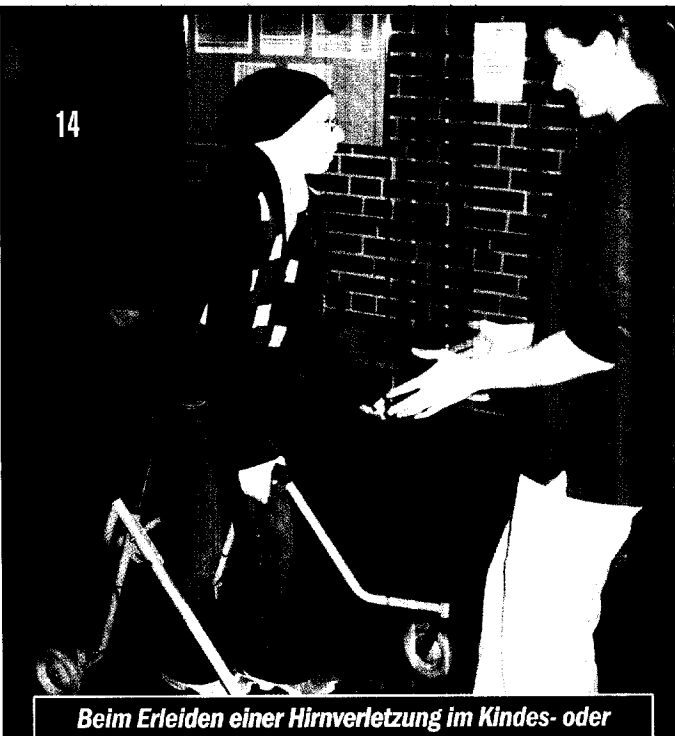
Beim Erleiden einer Hirnverletzung im Kindes- oder Jugendalter muss ein durchgängiger Rehaprozess von der Akutbehandlung bis zur Reintegration eingeleitet werden.