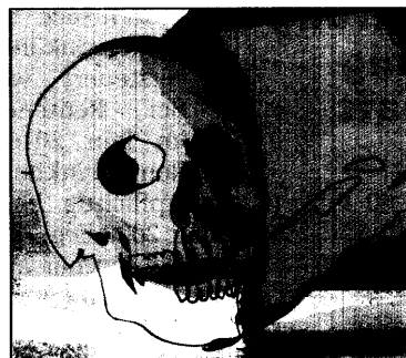
„Skull“ – diesen Siebdruck fertigte Warhol nach einem Schädel, den er auf einem Flohmarkt erwarb.