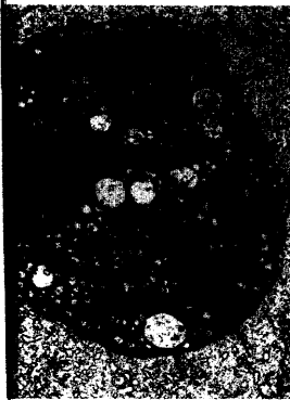
Phagozytierte schrumpfnekrotische Leberzelle.