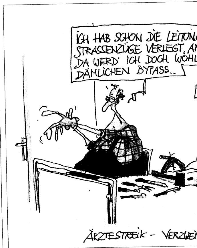
ÄRZTESTREIK - VERZWEI

Das hat die Republik noch nie zuvor erlebt: In Berlin gingen erst mehr als 15 000, einige Wochen sogar mehr als 30 000 niedergelassene Ärzte und Arzthelferinnen auf die Straße, um gegen die katastrophale Entwicklung in