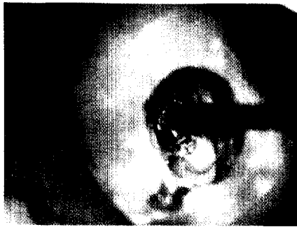
Wurzelfüllung Schritt für Schritt