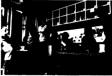
Angst ist für viele Asthmatiker ein Dauerthema. Eine psychologische Asthmaschulung kann dagegen hilfreich sein. Seite 9.