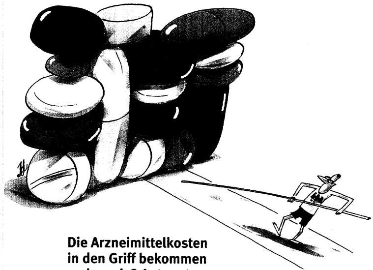
Die Arzneimittelkosten in den Griff bekommen – aber wie? Antworten ab Seite 32