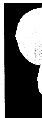
Streptococ sterelektro rien verur zündung ur

In den insgesamt sieben Jahren wurden 170 Säuglinge mit einer IPD in den ersten 90 Lebenstagen registriert, 24 davon erkrankten im Einführungsjahr der Impfung. 89 Säuglinge mit einer IPD wurden in den drei Jahren vor Einführung der Impfung registriert, was einer