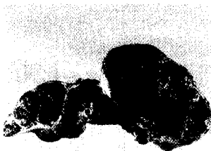
Explantierte Leber mit grobknotiger Leberzirrhose bei Alpha-1-Antitrypsinmangel (Quelle: Archiv des Institut Universitaire de Pathologie, Lausanne).