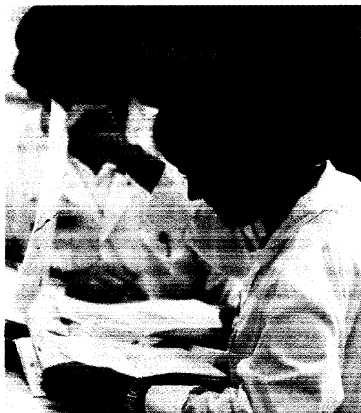
Vorsorgerisiko: Die Ehefrau arbeitet in der Praxis.

In vielen Praxen arbeitet der Ehepartner der Ärztin oder des Arztes mit, bisweilen sind auch andere Verwandte beschäftigt. Sie werden oft zur Rentenversicherung angemeldet und zahlen auch jahrelang brav ihre Beiträge. Wollen sie dann in den verdienten Ruhestand, kommt der Hammer: Die Rentenversicherung lehnt Rentenzahlungen ab und beruft sich dabei auf geltendes Recht. Für die Betroffenen oft eine böse