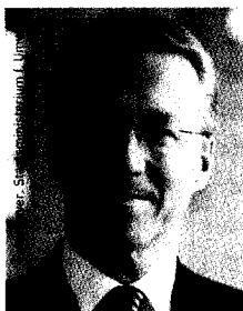
Dr. Werner Schnappauf, Staatsminister im Bayerischen Staats- ministerium für Umwelt, Gesundheit und Verbraucherschutz.

Auf der Website der Gesundheitsinitiative „Gesund. Leben. Bayern“ finden jung und alt wichtige Tipps zur Gesundheitsvorsorge. Mehr Prävention statt Reparatur ist der neue Weg im Gesundheitswesen – die Seite zeigt Projekte, mit denen wir den Weg in die eigenverantwortliche Gesundheitsvorsorge unterstützen.