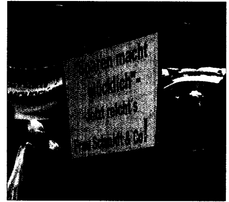
Tausende Ärzte und Helferinnen demonstrierten trotz Schnee und Kälte in Berlin.