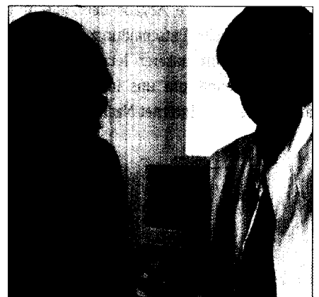
Private Zuzahlung zur ambulanten OP: Klingt verlockend, ist aber nicht rechtswirksam.