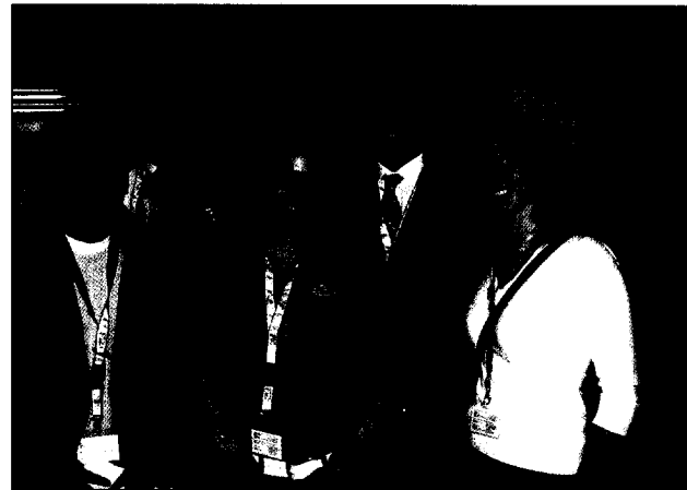
Aktuelles – Studenten wichtige Zielgruppe für die DGZI