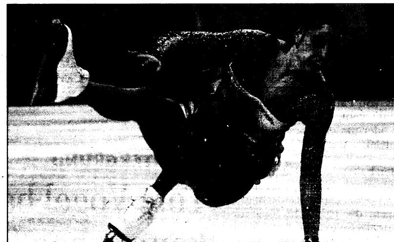
Das Ende der Goldhoffnung: Die italienische Eiskunstläuferin und Fahnenträgerin Carolina Kostner stürzt beim dreifachen Flip.

ganisation WHO ein Vogelgrippe-Verdacht vorliegt. Dies ist dann der Fall, wenn Patienten in einem Vogelgrippe-Gebiet Husten oder Durchfall bekommen und Kontakt zu kranken oder toten Vögeln hatten – etwa nach dem Entfernen toter Vögel aus ihrem Garten oder bei der Arbeit auf einem Bauernhof. Kommen solche Patienten in die Praxis, sollten sie bei einer