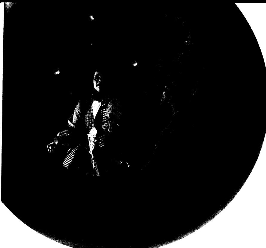
Grafik: Phil Saunders / Space Channel

In der Grafik spiegeln sich zweidimensionale Gitter in Kugeln – Symbol für eine holografische Theorie der Gravitation