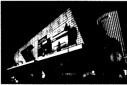
In Paris, Palais de Congrès, tagte die ECCO 2013