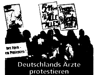
Deutschlands Ärzte protestieren

...vor, den Kopf in Äußert Verständnis für den Protest, ist aber trotz der Probleme zuversichtlich