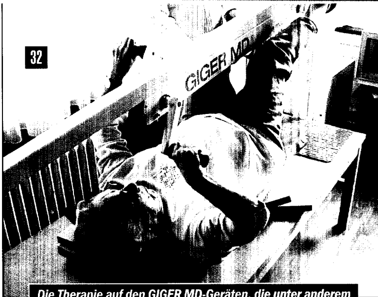
Die Therapie auf den GIGER MD-Geräten, die unter anderem bei Schlaganfall eingesetzt wird, beruht auf koordinierten rhythmischen Arm- und Beinbewegungen.