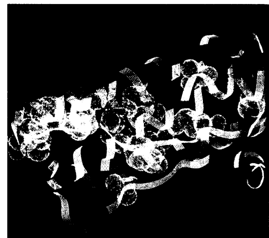
Durch die Kopplung mit Polyethylenglykol wird eine Wirkungsverlängerung von Arzneistoffen erreicht. Mit Pegfilgrastim steht nun ein pegylierter hämatopoetischer Wachstumsfaktor zur Verfügung. Seite 27