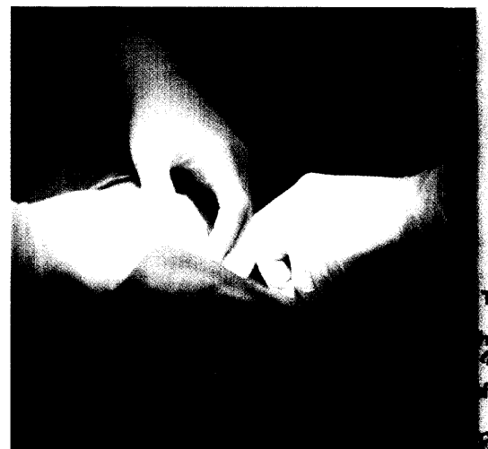
Diagnose Eierstockkrebs: Die Therapie basiert auf einer operativen Entfernung des Tumors und nachfolgender Chemotherapie. Bei zwei Dritteln der Frauen ist diese Therapie jedoch mangelhaft. Seite 26