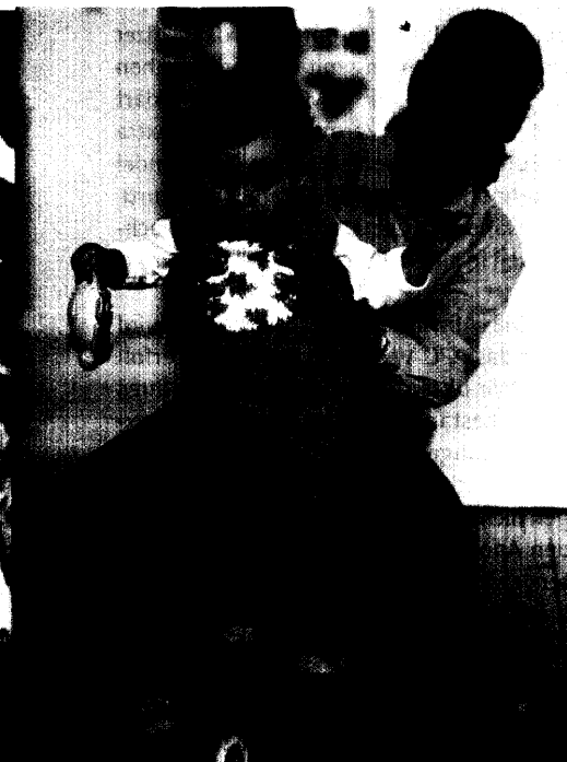
Der diesjährige Weltgesundheitstag widmete sich der Gesundheit von Müttern und Kindern, deren Sterblichkeit weltweit erschreckend hoch ist. In Deutschland sollen Kinder vor allem vor Passivrauchen und vermeidbaren Unfällen geschützt werden. Seite 34