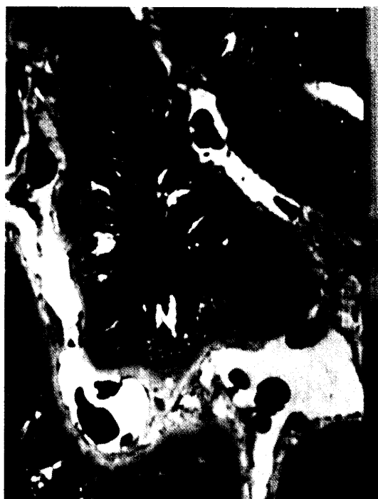
Die lebenslange Substitution des Enzyms Glucocerebrosidase ist Mittel der Wahl bei Morbus Gaucher (Abbildung: Vergrößerte Zellen auf Grund von Glykosphingolipid-Einlagerungen). Als Alternative steht Miglustat zur Verfügung. Seite 24