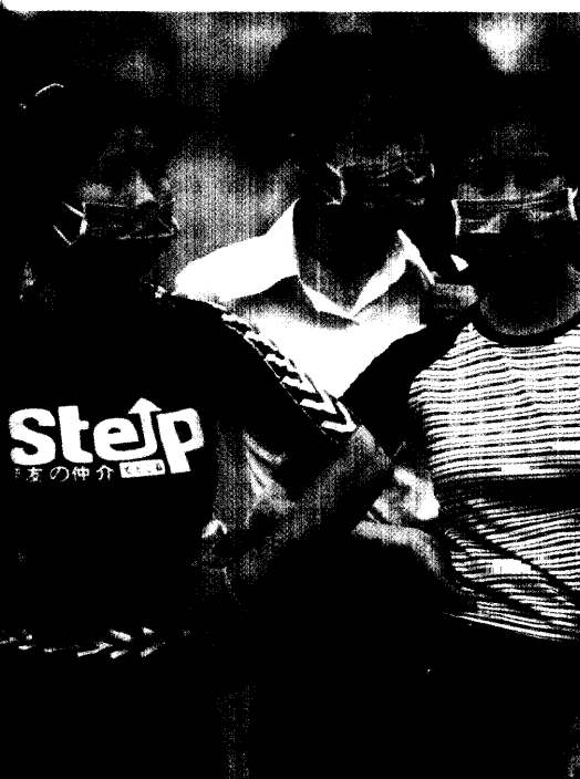
Superspreader: Klingt wie der Name eines Comic-Helden, ist aber etwas Unerfreuliches. Manche Patienten sind hoch infektiös und stecken massenweise andere Menschen an. Seite 36