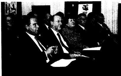
Am vergangenen Donnerstag feierte die PZ mit Vertretern des Berufsstands und der Medien ihren 150. Geburtstag.

150 Jahre Pharmazeutische Zeitung: »Eine großartige Leistung«