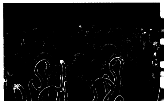
Der monoklonale Antikörper Rituximab (blau) richtet sich gegen das Oberflächenprotein CD20 von B-Zellen (rot). Diese spielen auch in der Pathogenese der rheumatoiden Arthritis eine Rolle und stellen daher ein neues Target dar. Seite 19