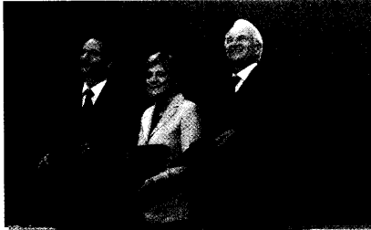
Platzek, Merkel und Stoiber präsentieren den Koalitionsvertrag. Auf die neue Regierung kommt viel Arbeit zu. Seite 8

Koalition: Kanzlerin mit schweren Aufgaben