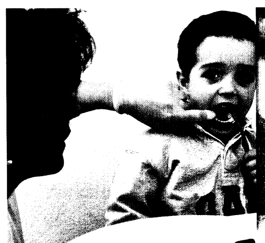
Karies und Parodontitis können auch das Risiko für andere Erkrankungen erhöhen. Mit der richtigen Mundhygiene bereits im Kindesalter muss es nicht so weit kommen. Seite 24

In dieser Ausgabe finden Sie das Supplement »PTA-Forum 11/05«.