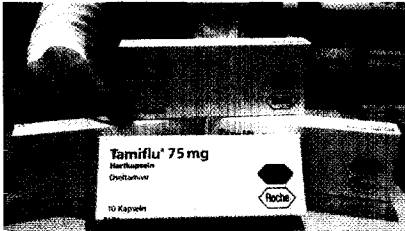
Der Pandemieplan weist den Apothekern in allen Bundesländern eine wichtige Rolle zu. Seite 8

Pandemieplan: Apotheken übernehmen Herstellung von Oseltamivir-Lösung