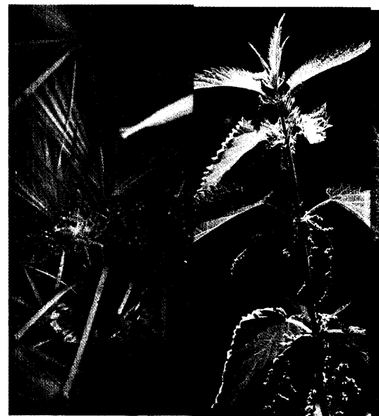
Ein Extrakt aus Sabalfrucht (links) und Brennnesselwurzel (rechts) kann beim benignen Prostatasyndrom (BPS) Symptome wie plötzlichen Harndrang und erhöhte Miktionsfrequenz deutlich lindern. Seite 26