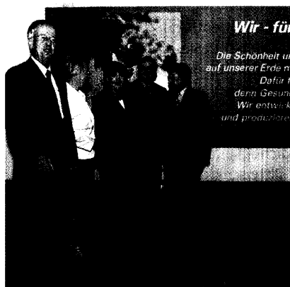
Unions-Kanzlerkandidatin Angela Merkel überraschte am Dienstag die Berlin Chemie AG mit einem Besuch. Mitgekommen waren die Kabinettskandidaten Annette Schavan und Peter Müller sowie Wirtschaftsberater Heinrich von Pierer. Seite 46