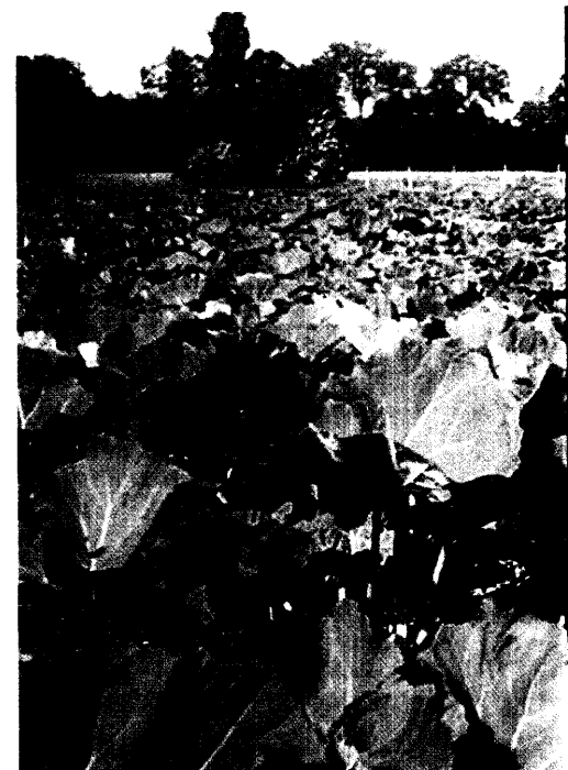
Meldungen über potenziell leberschädigende Wirkungen der Pestwurz führten zur Verunsicherung. Eine Nutzen-Risiko-Analyse kommt zu einer positiven Bewertung. Seite 26