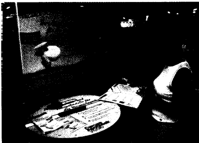
Die Rezeptsammelstellen von dm bleiben vorerst Geschichte. Das OVG Münster hat die einstweilige Verfügung gegen die Drogeriekette bestätigt. Seite 8

OVG Münster: Drogeriekette darf weiterhin keine Rezepte sammeln