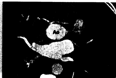
Abb.: C. Burgstahler/V. Hombach

...men ...teile ...drat ...ronie ...rzn ...ions ...yper ...inal ...gitt ...heit ...nos ...nder ...ung ...letter ...ngel ...im ...men ...teile ...drat ...ronie ...rzn ...ions ...yper ...inal ...gitt ...heit ...nos ...nder ...ung ...letter ...ngel ...im