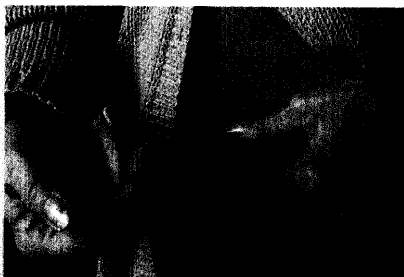
Abb.: Medical Picture