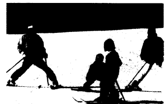
Früh übt sich!