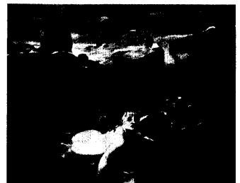
Im Spiel der Wellen.