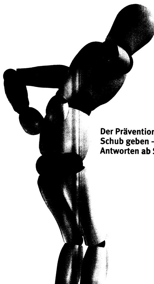
Der Prävention neuen Schub geben – aber wie? Antworten ab Seite 36